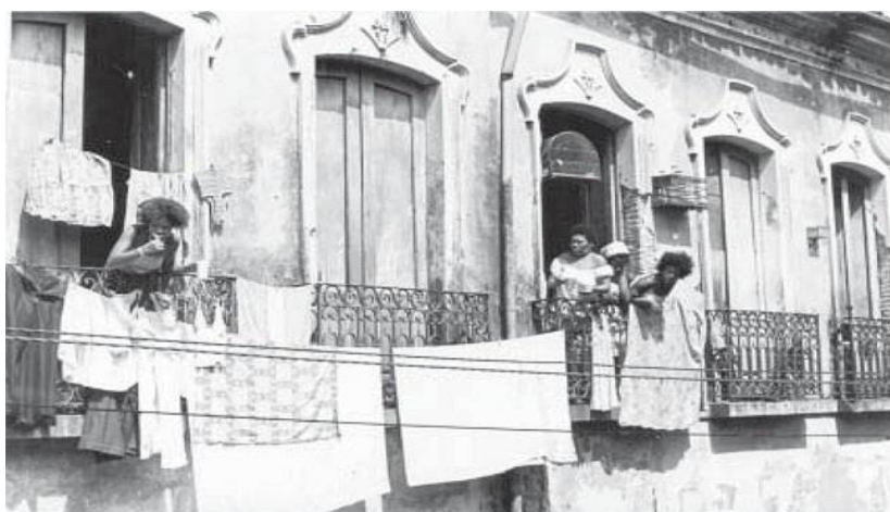
Figura 04 e 05: As imagens mostram edifícios degradados do Centro Histórico de Salvador

Em 1985, o centro histórico de Salvador foi reconhecido pela Unesco como Patrimônio da Humanidade, e com este reconhecimento a área do centro voltou a ter atenção, levando ao desenvolvimento de programa de revitalização, principalmente, para a região do Pelourinho, que era vista como um potencial turístico da cidade, de acordo com Nobre (2003) e em 1991, o Programa de Revitalização do Centro Histórico de Salvador se iniciou, através da iniciativa do então governador do estado, eleito pela terceira vez, Antônio Carlos Magalhães, que era um político conservador ligado as antigas oligarquias locais.