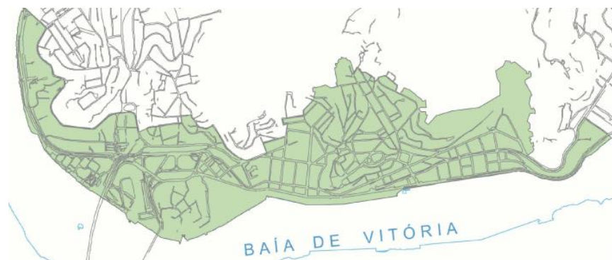
Figura 10: Área de Intervenção – Centro.