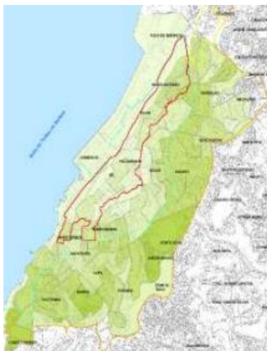
Figura 02: Mapa de Localização do Centro Histórico de Salvador na malha urbana da cidade.

No século XX, ocorreu a maior expansão da cidade com o surgimento de novos bairros e crescimento significativo da população. A Cidade Alta, ao sul, tornou-se área de maior predominância habitacional da classe privilegiada. Mais ao norte situaram-se bairros de classe média e mais a frente os bairros de classe baixa, que foram os que mais cresceram, conforme Koury (2004). Surgiram, nos anos 80 e 90, os shopping centers, causando impacto no comércio tradicional do centro da cidade, agravando o abandono da área.