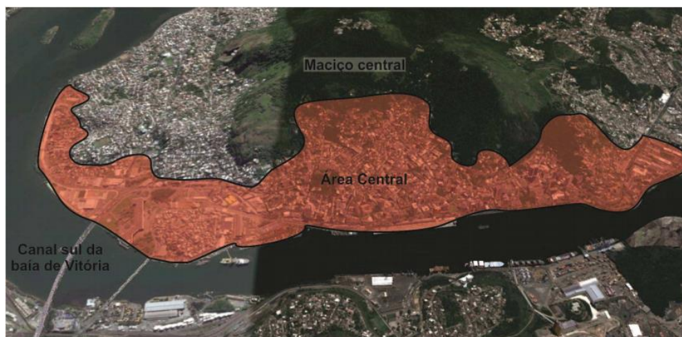
Figura 09: Localização da área central de Vitória- ES.

e sul da ilha de Vitória. A área central da cidade está localizada entre o canal sul da baía de Vitória, e se estende por 2,86km 2 , abrange o centro tradicional da cidade e imediações (TRINDADE, 2015).