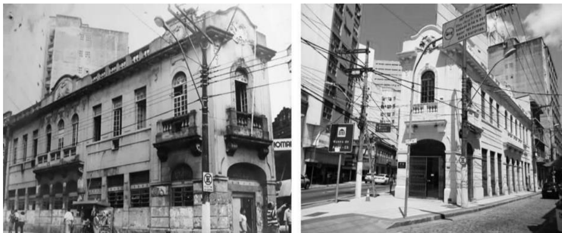
Figura 13 e 14 – (esq.) MAES em 1990, antes da intervenção de restauro e reabilitação, quando ainda permanecia desocupado. (dir.) MAES visto a partir da Rua Barão de Itapemirim.