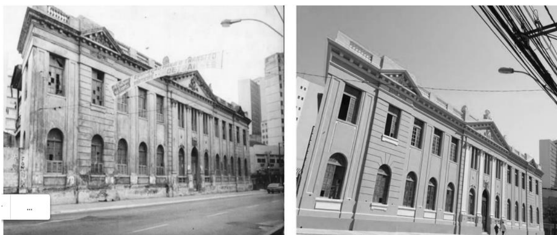
Figura 11 e 12 - (esq.) A FAFI em 1987, retratando o período em que permaneceu abandonada e entrou em degradação. (dir) Em 2018, abrigando a Escola Técnica Municipal de Teatro, Dança e Música FAFI.

Em 2003, ao transitar no centro de Vitória, os resultados dos esforços de revitalização eram vistos, com edificações públicas e privadas com suas fachadas desobstruídas e recuperadas. A encosta onde está o Palácio do Governo já apresentava uma paisagem renovada, com as escadarias recuperadas e pintadas. O porto também apresentava um aspecto surpreendentemente agradável face a outras regiões portuárias. Não se observavam os sinais ostensivos de abandono e de degradação comumente associados a esses espaços urbanos (BOTELHO, 2005).