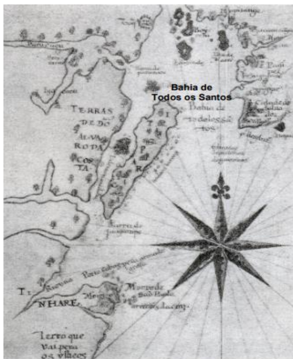
Figura 01: Mapa Quinhentista da Baía de Todos os Santos e da Cidade de Salvador.