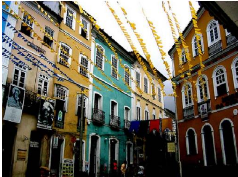
Figura 07: Largo do Pelourinho em Salvador, BA.