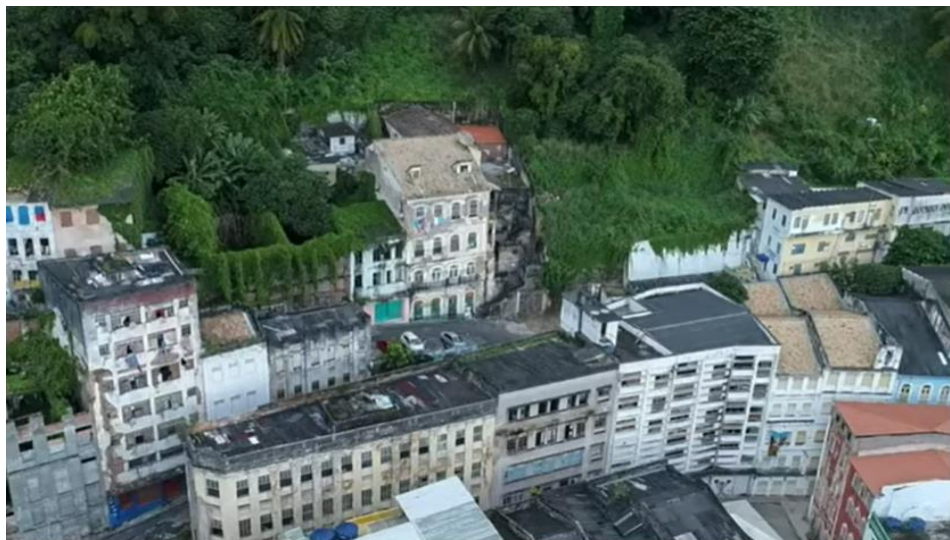
Figura 08: Imagem do Centro Histórico de Salvador e seu vazio urbano.

De acordo com Mourad (2011), isso foi “premeditado” para privilegiar o turismo no local. Observa-se, portanto, que a área utilizou o seu legado histórico e desprezou o seu papel social, para dar lugar à valorização da imagem e ao valor econômico. A área transformou-se em objeto de “gentrificação”, centro de consumo cultural de massa. Os críticos do projeto denunciaram a expulsão da população para as áreas periféricas, tornando a área de intervenção praticamente desabitada. Por outro lado, os defensores da intervenção, ressaltavam que sem estes deslocamentos não seria possível preservar o Patrimônio Histórico da cidade.